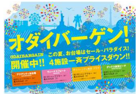
<2012夏のオダイバーゲンイメージ>