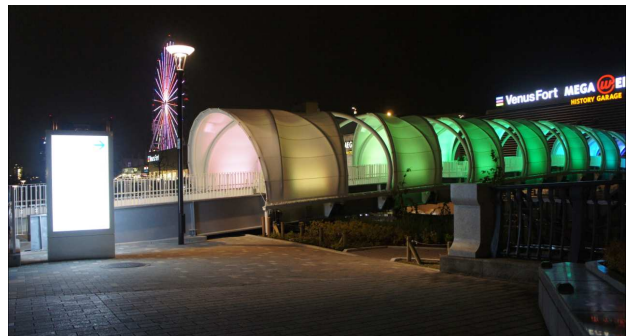
ブリッジの形状は、周囲の景観に配慮しながら、スタイリッシュな螺旋状のアーチ型デザインとし、夜にはLED照明で華やかに演出