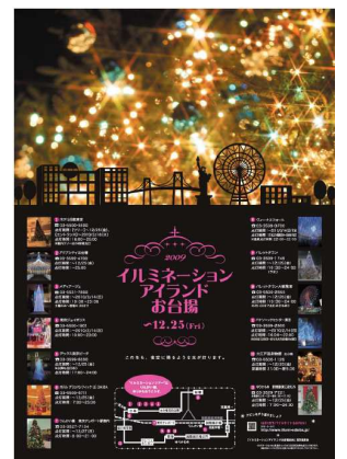
<過去のポスタービジュアル>

2012年は大人気アニメ“ONE PIECE”の劇場版最新作公開を記念し、各施設が“ONE PIECE”をモチーフとしたイルミネーションを展開。施設回遊型のスタンプラリーも実施し、多くのお客様にご参加いただきました。