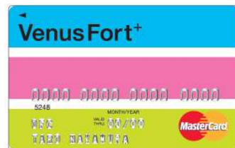
<ヴィーナスフォートパスポート プラス>