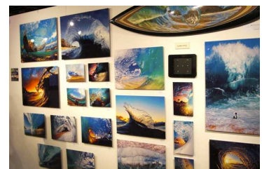
クラーク・リトル