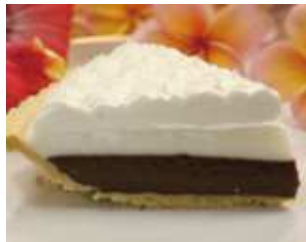
TED'S Bakery 「ハウピアパイ」