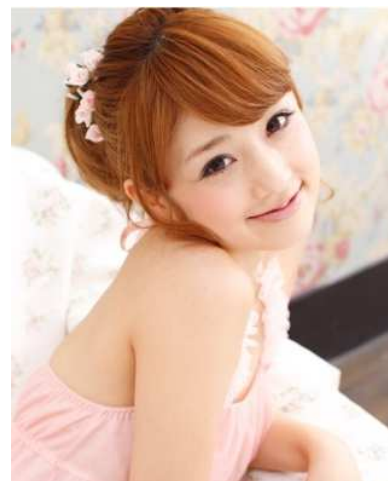
小倉優子 Ogura Yuuko グラビアアイドルとしてデビューし、現在はTV、雑誌、CM等で活躍。料理が得意でパンアドバイザーの資格を持つ。2011年にハワイで結婚式を執り行った。