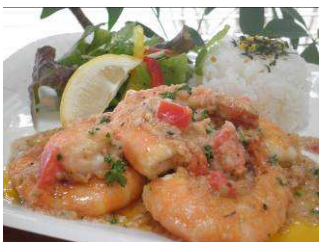
BLUE WATER SHRIMP 「ガーリックシュリンプ」