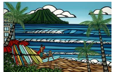
ヘザー・ブラウン作「Waikiki Holiday」

オアフ島ノースショアで2011年3月9日にスタートしたサーフアートプロジェクト。シャノン・オコンネルやパトリック・パーカーなど現在15名以上のアーティストが所属しています。