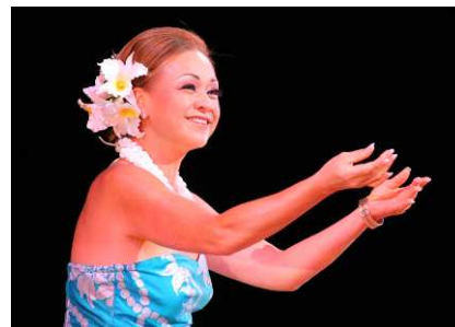
ナニ・リム・ヤップ&リムファミリー

ハワイを代表するトップミュージシャン。多彩な才能で知られ、ギターやベースのほかに、ピアノやバイオリンまで弾きこなす実力。ハワイではもちろん、日本のフラダンサーやハワイアン・ミュージック愛好家にもファンは多い。