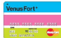
ヴィーナスフォートパスポートプラス

期間中、館内でヴィーナスフォートパスポートプラスによるクレジットのお支払100円(税込)につき、通常2ポイント(日曜日は3ポイント)のところ5ポイントをプレゼント。