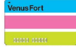
ヴィーナスフォートパスポート