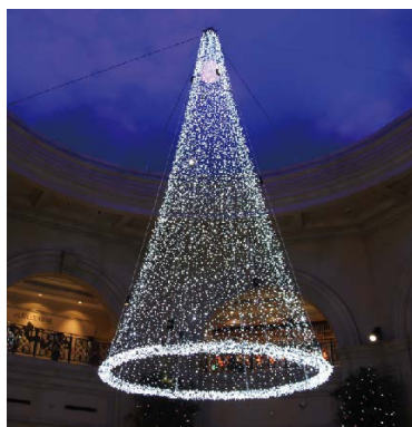
Spes's White tree A (希望のツリー)