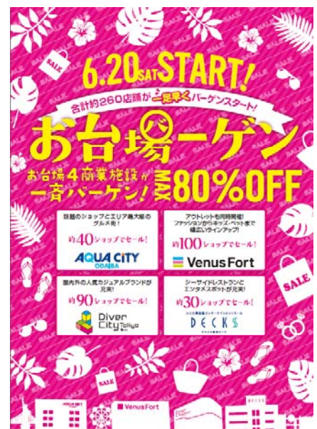
「お台場ーゲン」のメインビジュアル

「 デックス東京ビーチ (デックスビーチセール) 」 シーサイドレストランとエンタメスポットが充実! OFF率/店舗数 : 最大70%/約30店舗