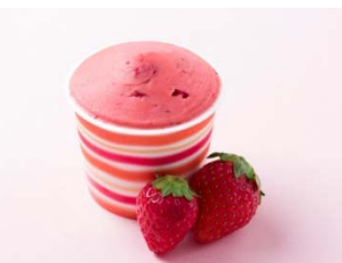
■a le Loic とちおとめグラッセ 490円～(税抜)