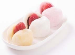
いちご大福各種 1個 200円(税込)