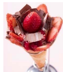
■MOMI & TOY'S とちおとめづくしのショコラクレープ 580円(税込)