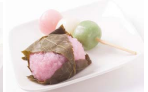
桜餅 1個 150円(税込) 花見団子 3本350円～(税込)