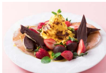
■タントタント たっぷりいちごとチョコバナナのザヴァイオーネパンケーキ 980円(税込)