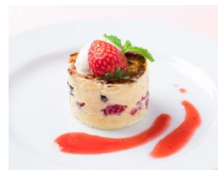
■イルフォルノ とちおとめのクレームブリュレ 650円(税込) / ドルチェセッコ 1,100円(税込)