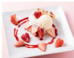
■AROUND TABLE とちおとめのバニラストロベリーフッフル 680円(税抜) ※1日15食限定