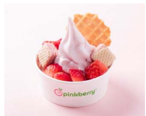
■ピンクベリー フローズンヨーグルト ～とちおとめトッピング 490円～(税込) ※無くなり次第終了