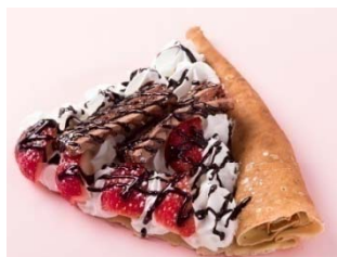
■ジェラフルソローノ とちおとめのバレンタインチョコクレープ 490円(税抜) ※1日10食限定