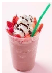
■ガーディナースカフェ ストロベリーモカシェイク 580円(税抜)