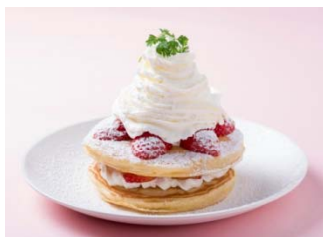
■チロリカフェ とちおとめのパンケーキ 980円(税込) ※1日20食限定

※各メニューのご提供数には限りがあります。 無くなり次第終了となりますので、予めご了承ください。