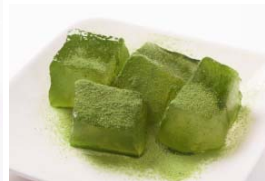
抹茶わらび餅 1P 550円(税込)