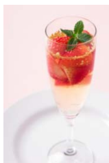
■バドリーノ・デル・ショーザン とちおとめのスプマンテジュレ 700円(税抜) ※1日10食限定