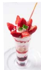
■RUBY CAFE とちおとめのストロベリーパフェ 850円(税込)