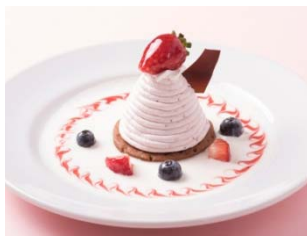
■コバラヘッタ とちおとめモンブラン 630円(税込)